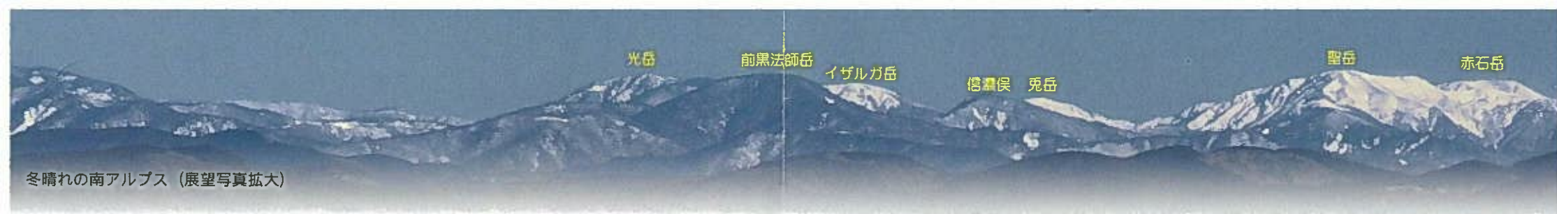
冬晴れの南アルプス (展望写真拡大)