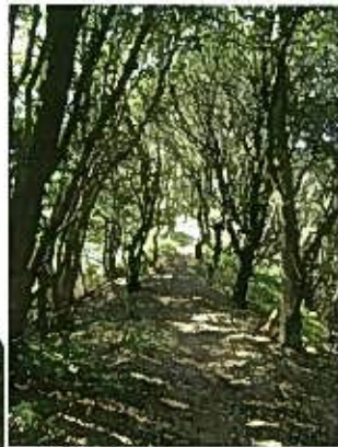
↑なだらかな尾根道