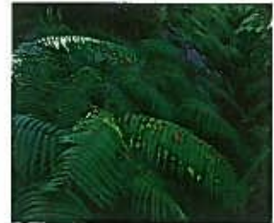
シダ類 (ウラジロの群生)

また、小笠山はかつて、赤松が多く『松茸山』と呼ばれていたこともありましたが、伐採やマツクイムシなどの影響で、いまではその面影も遠のいてしまいました。松茸のほか約 200 種のキノコ類が確認されています。また、山麓の湿地ではコケ類や湿原植物、水性植物、食虫植物などを見ることができます。