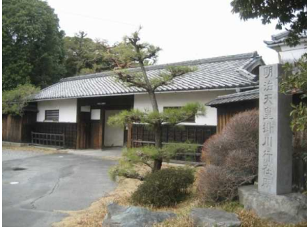
長屋門と行在所の碑