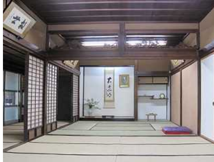
明治天皇が泊まれた座敷