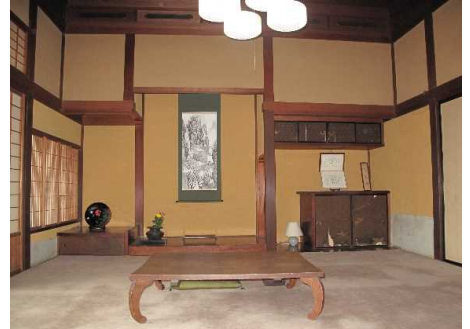
最高級の材木が使われた奥座敷